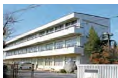
松島中学校 徒歩約8分(約0.6km)