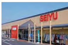
西友島内店 徒歩約5分(約0.4km)