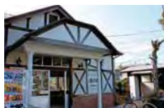
島内駅 徒歩約13分(約1.0km)

50周年記念モデル SHAWOOD M'Natura IORI 50th Anniversary Edition