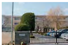
島内小学校 徒歩約14分(約1.1km)